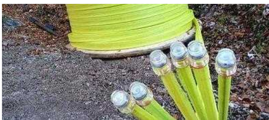
La posa della fibra ottica

Investimenti +6%, miglior performance in Europa. Il rapporto con il Pil scende all'1,6%, il livello minimo degli ultimi 15 anni