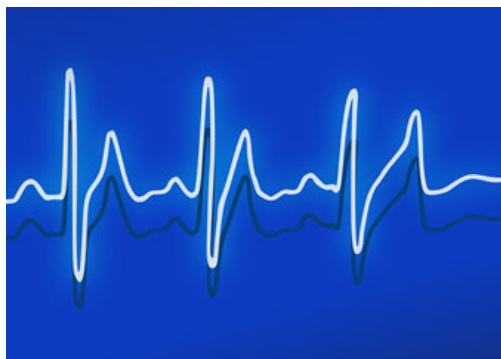
( http://www.editoriaimmagine.it/wp-content/uploads/2014/10/Grafico.jpg )

I dati riportati da Assinform non danno a intendere che tutto va bene: il primo semestre 2013 mantiene il segno negativo nel mercato complessivo, - 3,1 per cento. Alcuni segmenti, però, sono in crescita: il software con nuove soluzioni e applicazioni, 3,2 per cento, segno positivo, i contenuti digitali, +6,6 per cento, il cloud, + 35,7 per cento. Il mercato delle tecnologie , insomma, come tanti altri nel nostro paese, vive tutte le difficoltà della congiuntura economica attuale: ma mostra anche una timida ripresa .