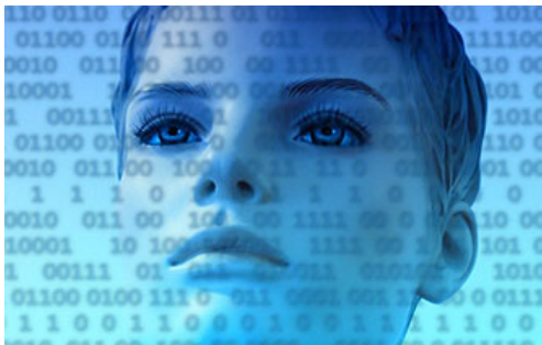
( http://www.editoriaimmagine.it/wp-content/uploads/2014/10/Donna_colonna.jpg )

voluto e dichiarato da Agostino Santoni è il primo autentico segnale di novità.