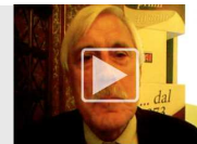
Crai, 40 anni e lo sguardo rivolto al futuro