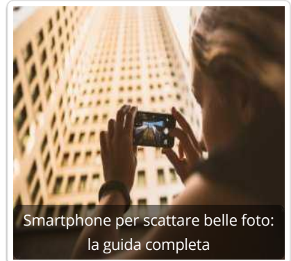
Smartphone per scattare belle foto: la guida completa