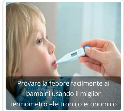
Provare la febbre facilmente ai bambini usando il miglior termometro elettronico economico