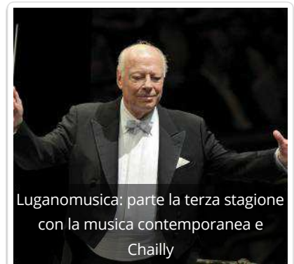
Luganomusica: parte la terza stagione con la musica contemporanea e Chailly

LEGGI SUBITO: La crisi della "classe creativa" e della teoria delle "Tre T"