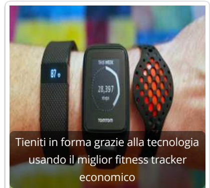
Tieniti in forma grazie alla tecnologia usando il miglior fitness tracker economico