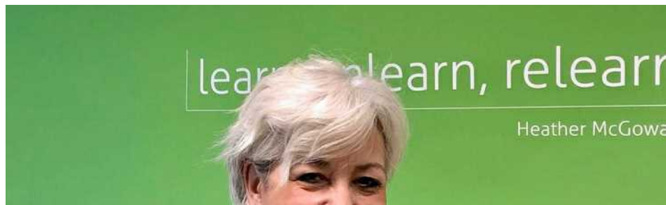
TAVOLA ROTONDA - "L'EVOLUZIONE DEI SYSTEM INTEGRATOR, LE VOCI DEI PROTAGONISTI"

L'evento, totalmente on line, ha l'obiettivo di promuovere il digitale come leva inclusiva e di accessibilità, sensibilizzare sul tema delle disabilità e delle fasce di popolazione più fragili che contano su una trasformazione digitale più fluida, etica e sostenibile. E che possono dare un contributo fondamentale al lavoro dei progettisti di servizi digitali.