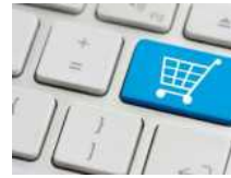
Troppe poche imprese puntano sull'e-commerce