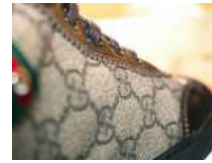
L'impatto della contraffazione sull'economia