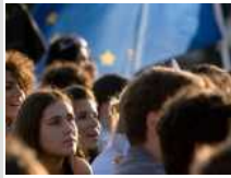
I giovani i più in difficoltà nel mercato del lavoro