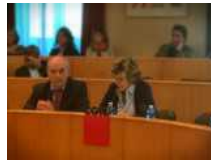
"Una politica che guardi al rilancio dell'occupazione"