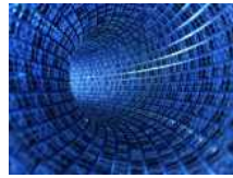
Mercato digitale in ripresa